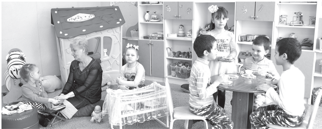
Занятие в группе.

Любовь к матери - это так же естественно, как сама жизнь.