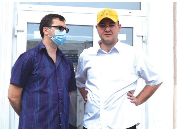
Фоторепортаж и видео - на сайте https://shakhty-media.ru/

дационного флешмоба-конкурса «Любимый вид спорта», организованного также при поддержке местного и регионального отделений Союза журналистов России. Юные шахтинцы рассказывали о своих спортивных увлечениях на страницах газеты, а наши читатели выбрали лучших.