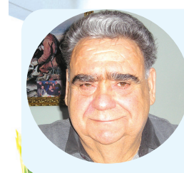
В зале тяжелой атлетики тренировался наш легендарный земляк - двукратный олимпийский чемпион, самый сильный человек планеты XX века Василий Алексеев .